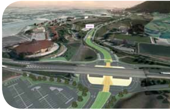
Le passage sous le pont de la RN 57

Lieu de manifestations diverses situé à seulement 3 km du centre-ville et sur les grands axes routiers, Micropolis était une étape obligée pour le passage du tramway. Afin que le tram passe au travers de la RN 57 sans en entraver la circulation, un ouvrage sera construit sous la route nationale, coupant ainsi le giratoire.